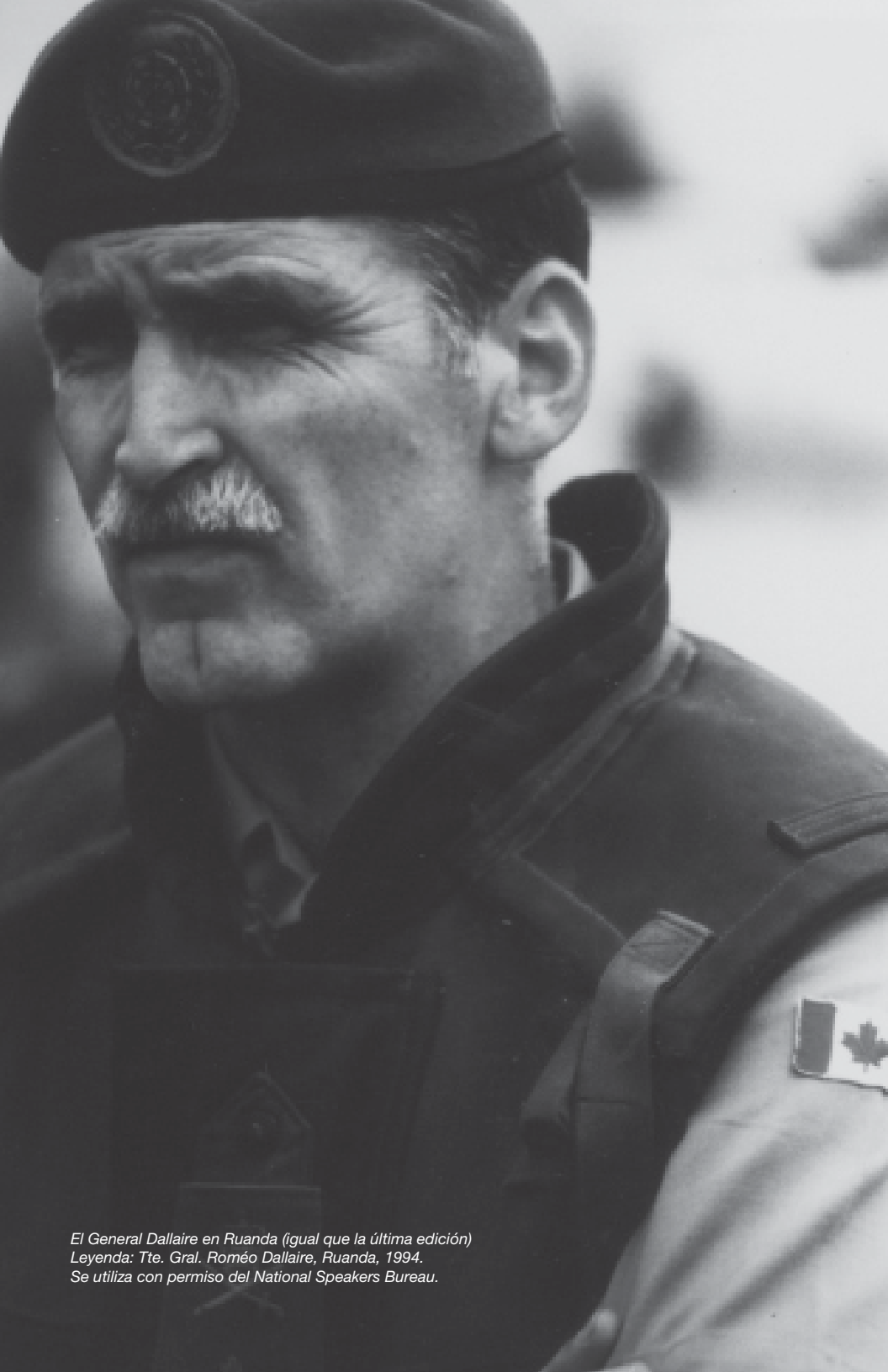
El General Dallaire en Ruanda (íguale que la última edición) Leyenda: Tte. Gral. Roméo Dallaire, Ruanda, 1994.