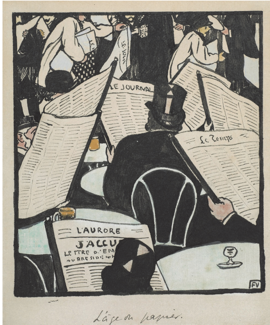
Félix Vallotton, L'âge du papier (1898)